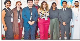
विभिन्न मुद्दों पर चर्चा के बाद प्रतिनिधि देशों के युवाओं ने पीछे छोड़ करवाया।

05 वर्षाण मुद्दों के अंतिम मसौदा पर एकमत हुए दुनियाभर के युवा