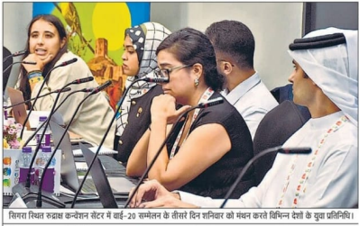
सिमा रिश्ता गठन कार्यक्रम सत्र के दौरान युवा प्रतिनिधियों के बीच चर्चा के दौरान।

वाराणसी, बरहिष्ठ संवाददाता। युवाओं के वैश्विक मुद्दों पर श्वेतपत्र तैयार करने की चर्चा होने के आसार है। जी-20 के तहत सत्रावधि सम्मेलन में 29 देशों और 13 अंतरराष्ट्रीय संस्थानों के 125 से ज्यादा युवा प्रतिनिधियों ने पांच घण्टीय मुद्दों पर मंथन कर इसे अंतिम रूप दिया।