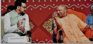
CM Yogi Adityanath along with Union minister Anurag Thakur during the 'Youth-20 Summit' in Varanasi on Thursday

"Vinayak Damodar Savarkar was sentenced to life imprisonment twice at the age of 28. Similarly, the Mahabharata recounts the valiant feat of 16-year-old Abhimanyu, who skillfully navigated the Chakravayuh. Another example of youth's remarkable contributions is Louis Braille, who devised a script for the blind when he was just 15-year-old. Einstein formulated the theory of relativity at the age of 16. Similarly, Newton introduced the theory of gravity at the age of 23," said Yogi.