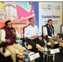
आस-सम्मान का निर्माण करेगा, भारतीय नीति-निर्माताओं के साथ बातचीत करने और सुझाव देने का

के लिए लेते हैं। शिखर सम्मेलन युवाओं को आवाज उठाने का अवसर देगा, युवाओं को स्थानीय समस्याओं के बारे में रचनात्मक रूप से सोचने के लिए प्रोत्साहित करेगा। यह सम्मेलन युवाओं को आवाज उठाने का अवसर देगा, युवाओं को स्थानीय समस्याओं के बारे में रचनात्मक रूप से सोचने के लिए प्रोत्साहित करेगा।