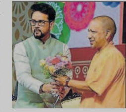
CM Yogi Adityanath and Union Minister of Youth Affairs & Sports Anurag Thakur at the Y20 Summit in Varanasi on Friday.

HT Correspondent letters@hindustantimes.com... VARANASI: Chief minister Yogi Adityanath on Friday said that whether it was Lord Ram or Lord Krishna, Adi Shankaracharya or Swami Vivekananda, the youth always gave a new direction to the society in each era... Yogi, along with Union minister for youth affairs and sports Anurag Thakur, inaugurated the Y20 (Youth 20) Summit under the G20 framework hosted by the department of youth affairs, Union ministry of youth and sports, at Rudraksh International Convention Centre in Varanasi.