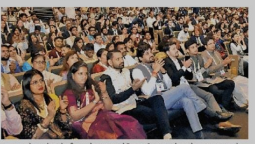
रूद्राक्ष कन्वेंशन सेंटर में जी-20 के अंतर्गत वाई-20 सम्मेलन में युवाओं को रोबोट बनाने का प्रदर्शन दिखाते हुए केंद्रीय मंत्री अनुराग ठाकुर।

जगरम संघटनवादी, वाराणसी। आधुनिक युवाओं के अंदर रहने वाले अर्थों को प्रेरित करने का है। इससे स्टार्टअप कर्मचारियों को नए रास्ते मिलेंगे। देश में 35 हजार युवाओं ने रूट और रोबोट बनाना सीखा है। विश्व में अग्रणी को पता है कि युवाओं को रोज व बड़े सत्र के बीच बनाने का अर्थशास्त्र क्या है। उन्होंने युवा तकनीकी में काम आना सिखाया है। ऐसे युवाओं के लिए देश में 2025-26 तक 1000 नई प्रयोगशाला स्थापित करने की कोशिश है। वह शुक्रवार को सिंगर के रूद्राक्ष कन्वेंशन सेंटर में जी-20 सम्मेलन के अंतर्गत वाई-20 सम्मेलन को संबोधित कर रहे थे।