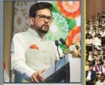
वाई-20 समिट का शुभारम्भ वाराणसी में हुआ।