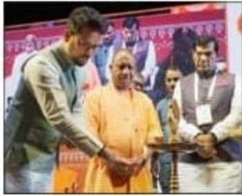
वाई-20 समिट का शुभारम्भ वाराणसी में हुआ।

वाई-20 समिट अन्तर्राष्ट्रीय स्तर पर वाई-20 के शुभारम्भ के कार्यक्रमों में शामिल हो रहे हैं। वाई-20 समिट का शुभारम्भ 29 से 31 अक्टूबर तक वाराणसी में होगा। वाई-20 समिट का शुभारम्भ 29 से 31 अक्टूबर तक वाराणसी में होगा।