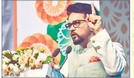
रुद्राक्ष में शुक्रवार को वाई 20 सम्मेलन में बोलते केंद्रीय मंत्री अनुराग ठाकुर।

वाराणसी, बरिष्ठ संवाददाता। कांग्रेस नेता रणदीप सुरजेवाला के हरियाणा में दिए बयान पर केंद्रीय खेल मंत्री अनुराग ठाकुर ने पलटवार किया है। उन्होंने कहा कि भाजपा नेताओं और उन्हें वोट देने वालों को रक्षक कहेगा सुरजेवाला की पार्टी को सोच दर्शाता है। देश में 40 करोड़ से ज्यादा परिवारों में भाजपा पर भरोसा जाता है। उन सभी को कांग्रेस नेता रक्षक को उपा