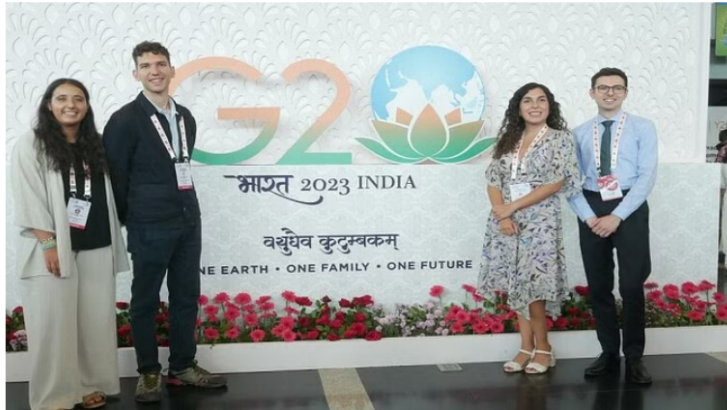
जी20 की तर्ज पर वाराणसी में वाई20 का आयोजन

वाराणसी में आयोजित चार दिवसीय वाई20 (यूथ समिट) का समापन रविवार को हो गया। वाई20 देशों से आए प्रतिनिधियों के सुझावों को शामिल कर ड्राफ्ट तैयार किया गया है। इस मसौदे को युवा कल्याण एवं खेल मंत्रालय को भेजा जाएगा।